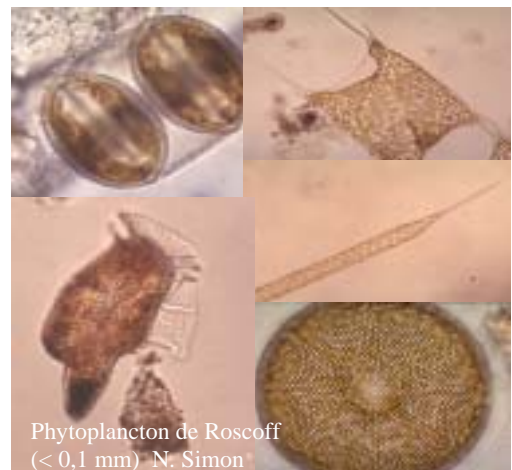
Phytoplancton de Roscoff (< 0,1 mm) N. Simon

Au large de Roscoff, il existe des centaines d'espèces de phytoplancton que l'on peut reconnaître par leurs différentes formes. Certaines espèces possèdent des sortes de cornes qui peuvent être très longues et qui leur permettent de flotter.