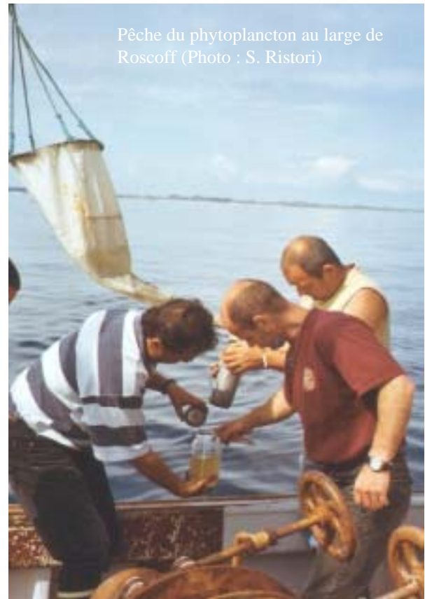
Pêche du phytoplancton au large de Roscoff

Il faut un microscope pour observer du phytoplancton.